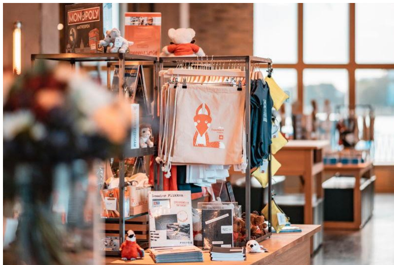
Bezoekerscentrum Het Steen

Het aantal bezoekers van de toeristische infobalie in Het Steen heeft dit jaar een recordhoogte van 470.374 bereikt, een stijging van 2,7% ten opzichte van vorig jaar. Inclusief de bezoekers van de balie in het Centraal Station, komt het totale aantal bezoekers aan de infobalies uit op 579.423. In de bezoekerscentra is 61% van de bezoekers afkomstig uit het buitenland en 39% van de bezoekers afkomstig uit binnenland, waarvan 21% uit Antwerpen zelf.