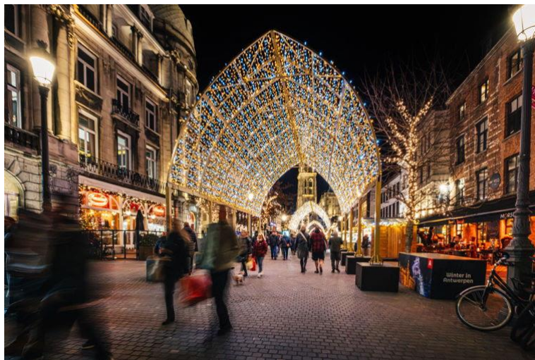
Winter in Antwerpen

Vijf van de tien drukstbezochte dagen in 2024 vonden plaats in december. Het kerstshoppen en Winter in Antwerpen trokken veel bezoekers aan. De absolute topdag in 2024 was 28 december, met 87.400 bezoekers.